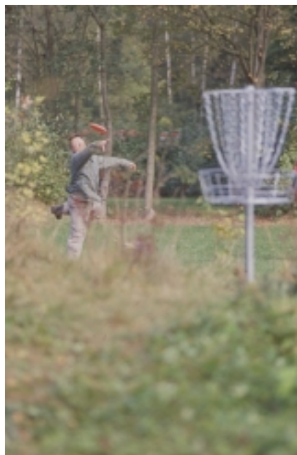
Beim "Putten" auf den Korb

(at) Die aktuelle Saison ist nun vorbei. Wir haben in dieser Saison einiges an positiven Dingen zu berichten! Es ist uns nämlich gelungen, weitere neue Disc-Golf-Plätze in Deutschland zu errichten. Und des Weiteren haben natürlich hieraus resultierend auch wieder einige neue Turniere stattgefunden. Also auch die Zahl der aktiven Spieler steigt – nach einer kleinen Flaute in den letzten Jahren tut das dem Disc-Golf in Deutschland wieder mal gut.