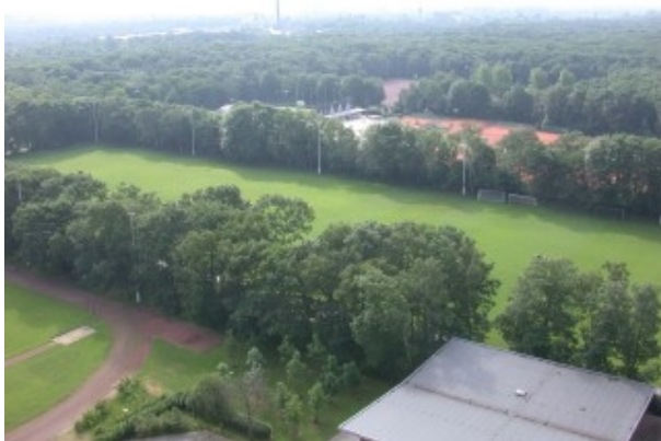
Ultimate-Felder in Duisburg

(tg) Seit 1981 finden alle vier Jahre die World Games statt. Diese internationale Mehrsport-Veranstaltung, verkürzt als „Spiele der nicht-olympischen Sportarten“ definiert, ist eine Plattform für sehr viele unbekannte Sportarten wie Korbball, Casting oder Netball, aber auch für Bekannteres wie Fallschirmspringen und Wasserski. Es genügt aber nicht, nicht-olympisch zu sein, eine Sportart muss auch mit seinem Weltverband als Mitglied von der International World Games Association (IWGA) aufgenommen werden und in der ausrichtenden Stadt muss die benötigte Sportstätte vorhanden sein. Seit Mitte der 90er Jahre ist der WFDF Mitglied in der IWGA und konnte in 2001 erstmals zu den World Games in Akita, Japan, Teilnehmer für Disc Golf und Ultimate entsenden.