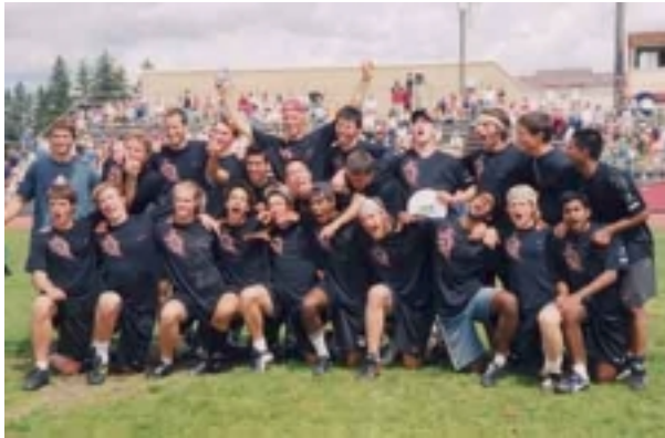
Stanford - UPA College Open Champions 2002 (und 2001) http://smut.stanford.edu