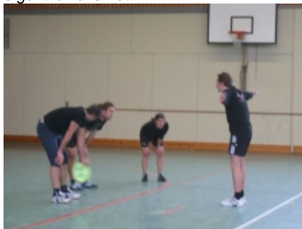
Erschöpfung auf der Line

Die Dresdner bekamen wie im Vorjahr den Spiritpreis. Dazu Ulli aus Berlin: „Den Spiritpreis haben übrigens die Deckeldreher aus Dresden verteidigt, den sie gemeinsam mit den Spreeperlen knapp vor so ziemlich jedem anderen Team gewannen. Es waren also eigentlich alle nett.“