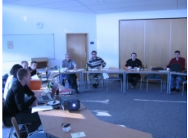
Die JHV in Kassel

Trotzdem wurden sehr interessante Themen behandelt. Neben der Neuwahl des Präsidiums standen Erweiterungen für den Bestandserhebungsbogen, die Ziele des DFV für die Zukunft, die Einrichtung eines Pressereferates, Satzungsänderungen und verschiedene Anträge auf der Tagesordnung.