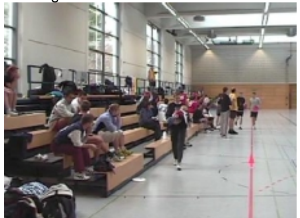
Gute Stimmung unter den Zuschauern

Die Open-Entsprechung zu den Sun Kids waren die Mir San Mir, die in den Vorrunden nur ein Spiel gegen Sauerlach (Platz 3.) verloren (Endstand: 12:10 für die Woodies). Bernd von den Mir San Mir dazu: „Ob wir gegen Sauerlach verloren haben weil die Konzentration etwas gefehlt hat (wir wussten, dass wir mit 4 Punkten Unterschied verlieren können) oder (auch) aus anderen Gründen, ist die Frage.“ Jedenfalls sind die Mir San Mir und die Frizzly Bears dann im Dreiervergleich mit den Woodies ins Finale gekommen.