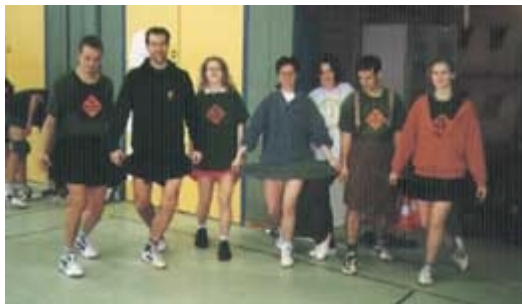
Die neu gestaltete Webseite der Hallunken http://www.burg-halle.de/~max/ultimate/heimat/main.htm