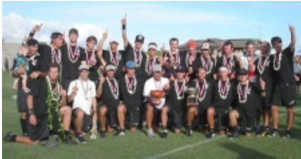
WFDF Ultimate Champions 2002 Santa Babara Condors : www.seidler.com/condors