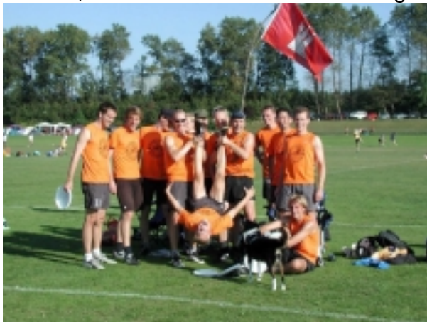
Das Team "Hardfisch"

Durch zugereiste Spieler und auch eigenen Nachwuchs konnte sich ein fester Stamm von Spielern bilden, eine solide Basis, so dass ein die Trainingsbedingungen derart optimiert werden konnten, dass die „alten“ abgewanderten und erfahrenen Spieler von damals wieder rekrutiert werden konnten. Mittlerweile erscheinen zu den halb-jährlichen „Tryouts“ Spieler aus diversen umliegenden Orten, um in einem der nach Leistung selektierten Teams zu landen. Neben dem Team Hardfisch formiert sich zur Zeit das Team Happyfisch, eine Art von Ladyfisch und auch Juniorfisch. Scheiben mit dem Hamburger Logo drauf fliegen auf fast jedem deutschen Turnier herum, die Fischbees sind Ausrichter eines jährlichen BULA Strandturnieres auf Mallorca, dem Copa Pescadisco. Im Bereich der Sportlehrerfortbildung konnten dieses Jahr über 100 SportlehrerInnen erreicht werden, Schülerturniere sind in Planung.